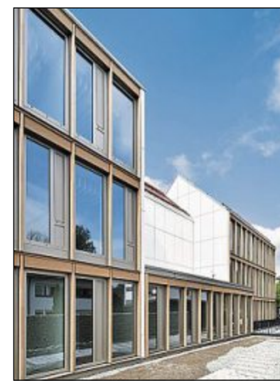
Große Fenster lassen viel Licht ins Innere.

Die einzelnen Einheiten mit einer Größe zwischen 100 bis 350 Quadratmetern wurden flexibel an die Wünsche und Bedürfnisse der Mieter angepasst. Die Räumlichkeiten in Ebene zwei und drei wurden als Maisonette-Einheiten angeboten. Durch die Ost-West-Ausrichtung in Verbindung mit großen Fenstern sind alle Räume optimal belichtet. Die Sparkasse Nürnberg hat mit dem Quartier No11 und der