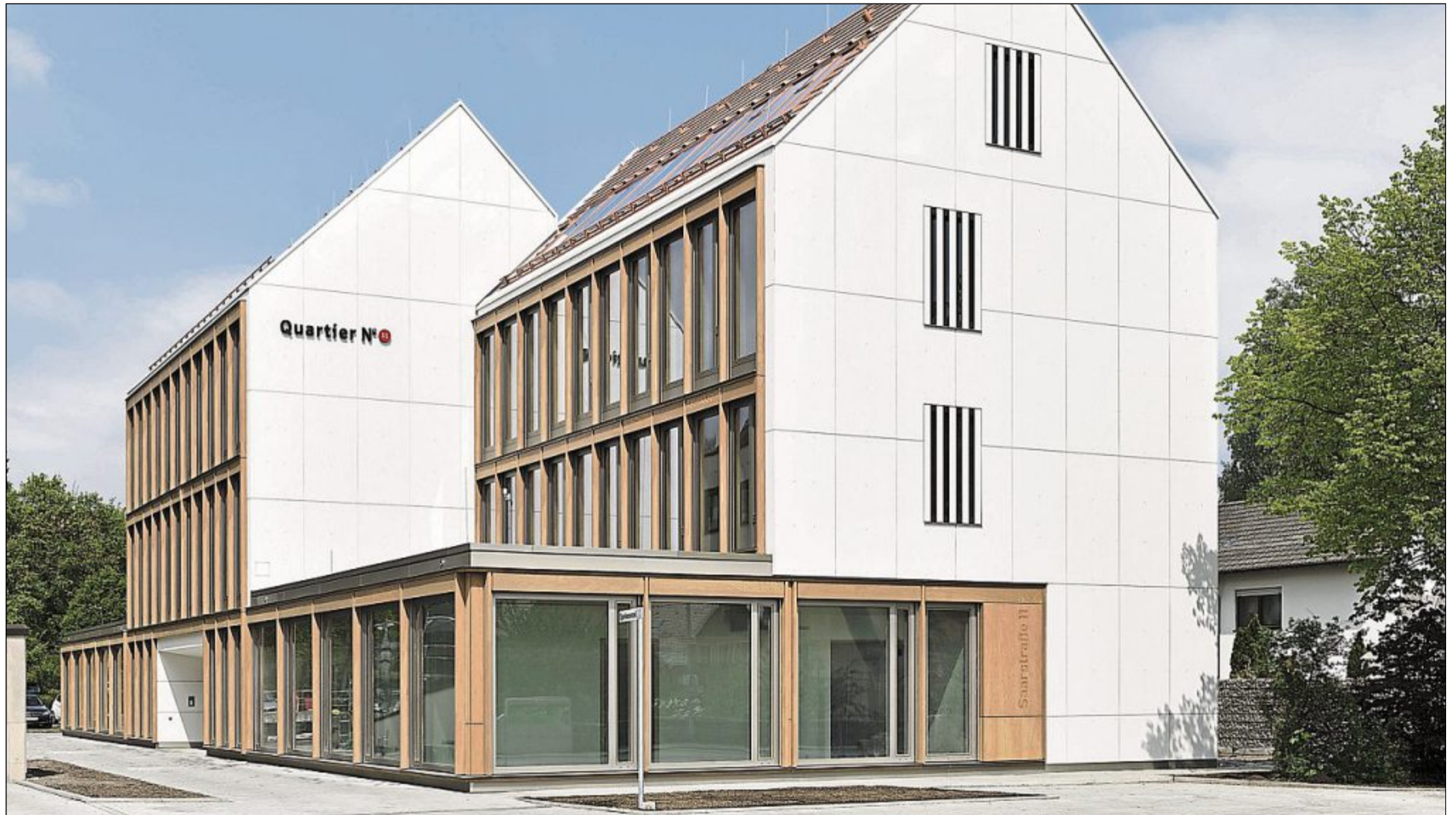
Der dreigeschossige Neubau besteht aus drei Einzelkörpern, die im Erdgeschoss verbunden sind.

Der Neubau befindet sich im Zentrum der Stadt Lauf, dessen Kern vom fränkisch-mittelalterlichen Baustil geprägt ist. Davon wurde auch die Außengestaltung inspiriert: Für das dreigeschossige Gebäudeensemble aus drei Einzelkörpern, die im Erdgeschoss verbunden sind, wurde ein Satteldach gewählt. Damit passt sich das Gebäude optisch gut in das umgebende bauliche Ensemble ein.